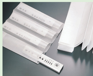
使用例 (家電部品の包装)